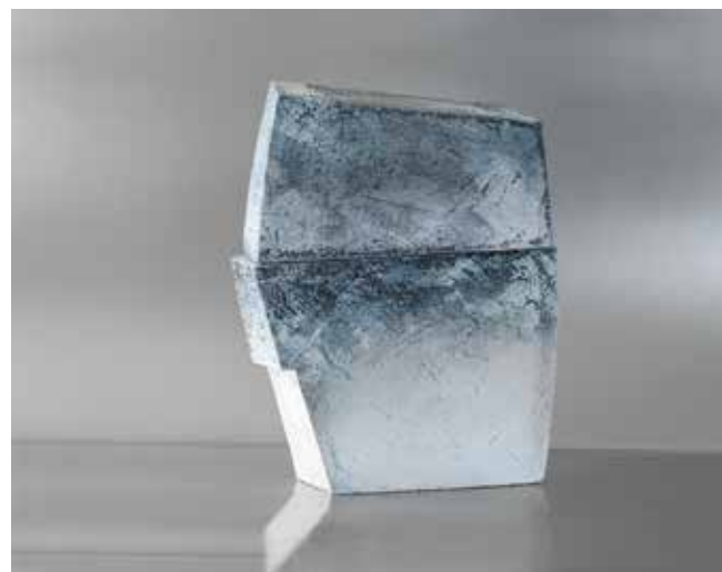
BENOÏC, 30 x 38 x 9 cm, grès 2015